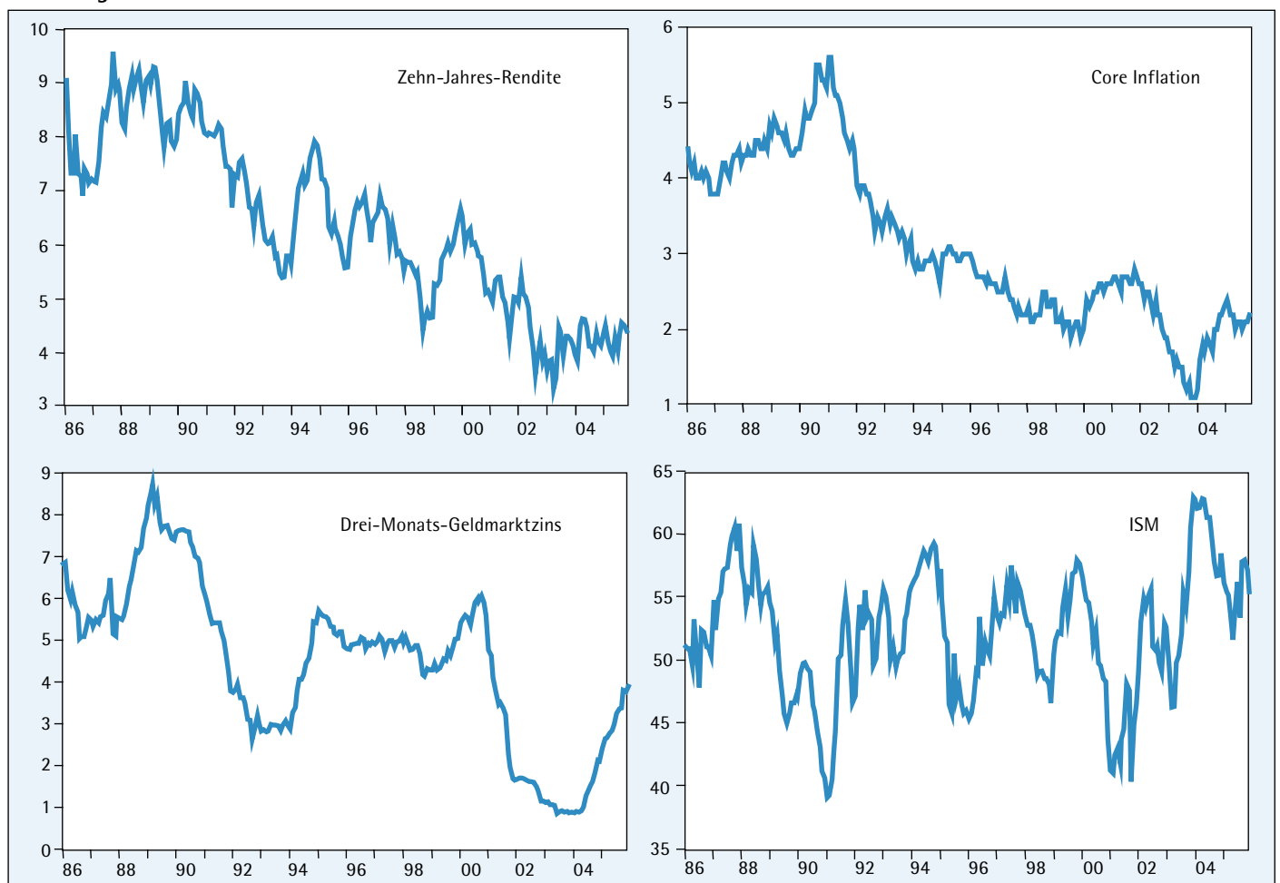
Abbildung 1: Die Variablen des Zinsmodells

Bei der Schätzung des Modells wird auf folgende monatlichen US-Daten zurückgegriffen: 1) Die zehnjährige US-Rendite, den dreimonatigen Geldmarktzins, als Maß für die Inflationserwartungen die Jahres-